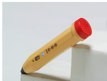
「音のでるペン(音筆)」