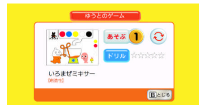
ドリル付ゲーム画面。「いろまぜミキサー」より