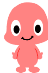
メイン キャラクター おーちゃん

「まいにちがたからもの」は、2005年発売の、パソコンを使ったコミュニケーション型の幼児教材です。そのメインキャラクター“おーちゃん”を使ったWii ウェア™『こども教育テレビWii あいうえ・おーちゃん』(© LSI/旺文社/HomeMedia)が2009年4月、書籍「あいうえ・おーちゃんドリル1 ことばあそび」「あいうえ・おーちゃんドリル2 かずとカタカナ」が2009年7月、Wii ウェア™『こども教育テレビWii アイウエ・オームズ』(© LSI/旺文社/HomeMedia)が2009年8月に、それぞれ発売されました。