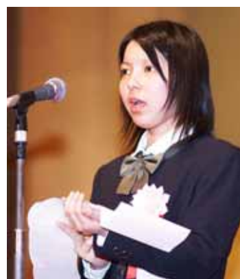
内閣総理大臣賞 受賞者によるスピーチ

全国学芸科学コンクールは中国との文化交流を目的に、中国の出版社「中国少年儿童新聞出版総社」が主催する各種コンクールの上位入賞作品の特に優秀なものに対して、「旺文社社長賞」の授与も行っております。昨年の第51回表彰式には、本賞を受賞した生徒も、中国から出席しました。受賞パーティーでは、日本人の受賞者と言葉の壁を越えて、楽しげに交流している姿が見受けられました。