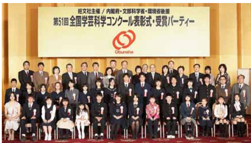
第51回 表彰式にて 金賞受賞者と審査員、授与の先生がた