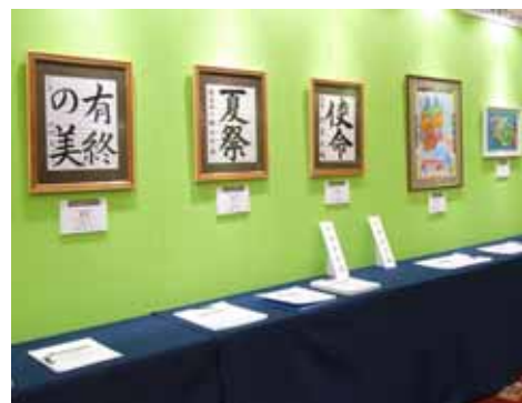
表彰式会場に展示された受賞作品