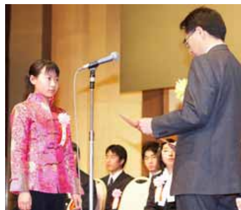
中国からの受賞者

全国学芸科学コンクールは中国との文化交流を目的に、中国の出版社「中国少年儿童新聞出版総社」が主催する各種コンクールの上位入賞作品の特に優秀なものに対して、「旺文社社長賞」の授与も行っております。昨年の第51回表彰式には、本賞を受賞した生徒も、中国から出席しました。受賞パーティーでは、日本人の受賞者と言葉の壁を越えて、楽しげに交流している姿が見受けられました。