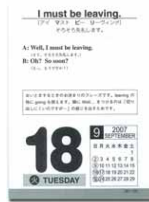
No.3 日めくり英会話カレンダー