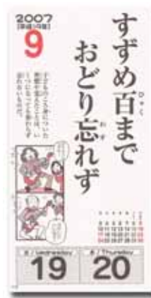
No.2 ことわざカレンダー