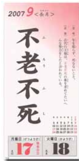
売筋 No.1 四字熟語カレンダー